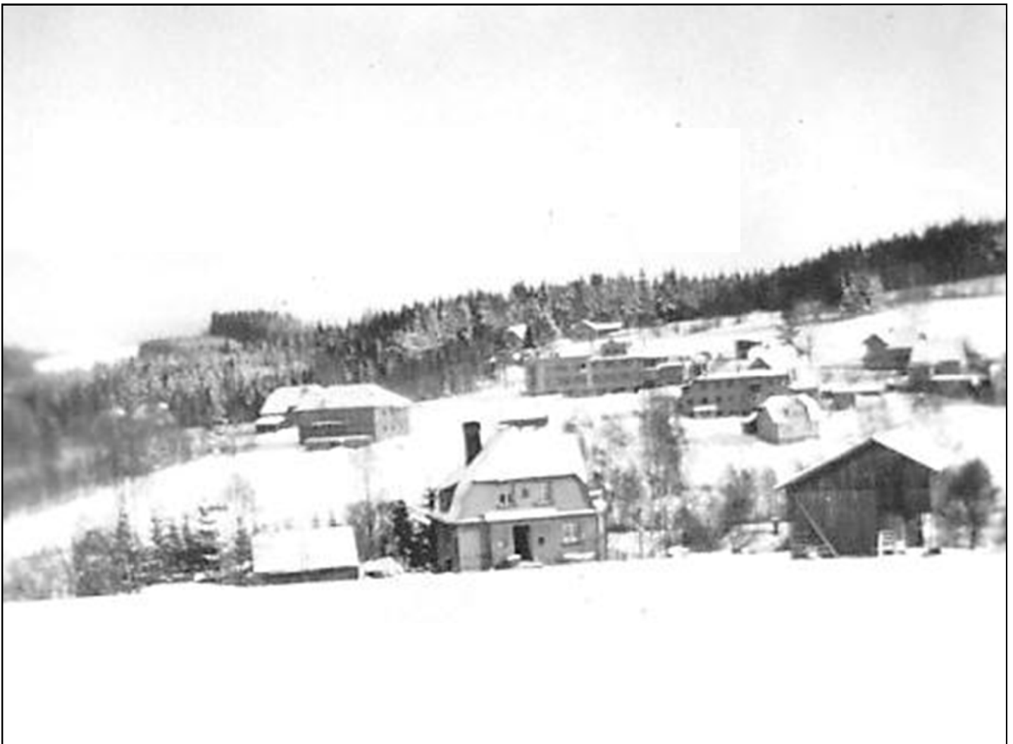
Pohled na Loužnici z Kostřavce (v pozadí ještě nedostavěná část velkého sálu v sokolovně)

Na svatého Tomáše nejděle noc naše. Na svatého Tomáše zima se rozpáše. Na svatého Tomáše zima je naše. O svatém Tomáši meluzína straší. Jestli na Tomáš Biskupa slunce svítí, můžeme mnoho ovoce a žita mít.