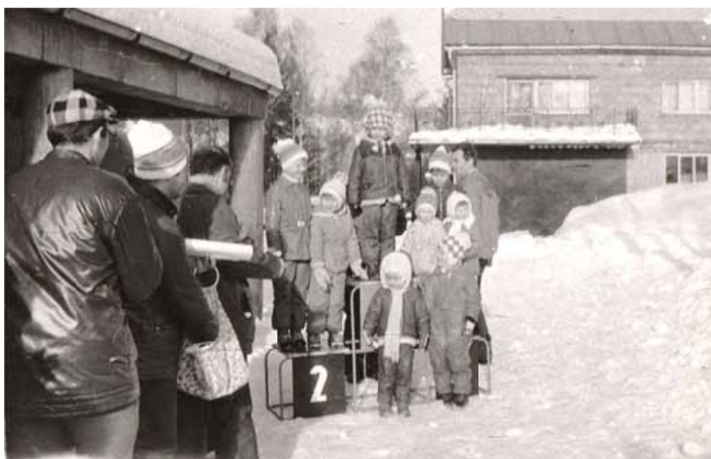
Lyžařské závody u „kulturního domu“ (rok cca 1978)

http://hydronet.tumam.cz/content/cz/Default.aspx