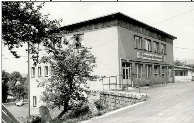
Dobová fotografie naší hospůdky/domu potravin z roku 1980.

Vaše materiály použijeme na výstavku a nepoškozené vrátíme. Děkuje.