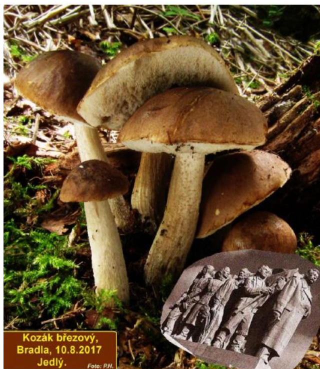
Kozák březový, Bradla, 10.8.2017 Jedlý.