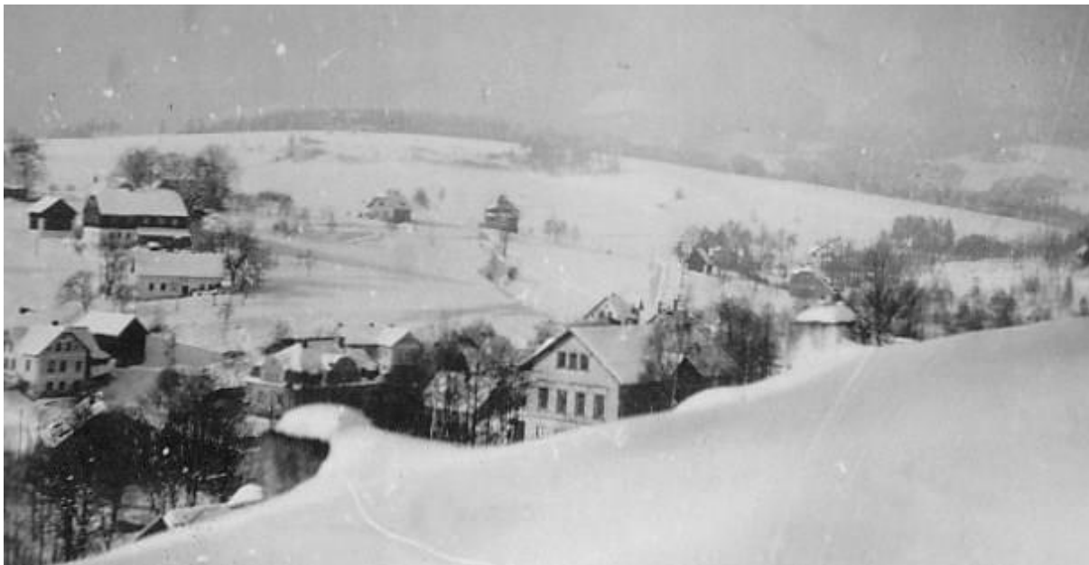
Foto: pohled na Loužnici