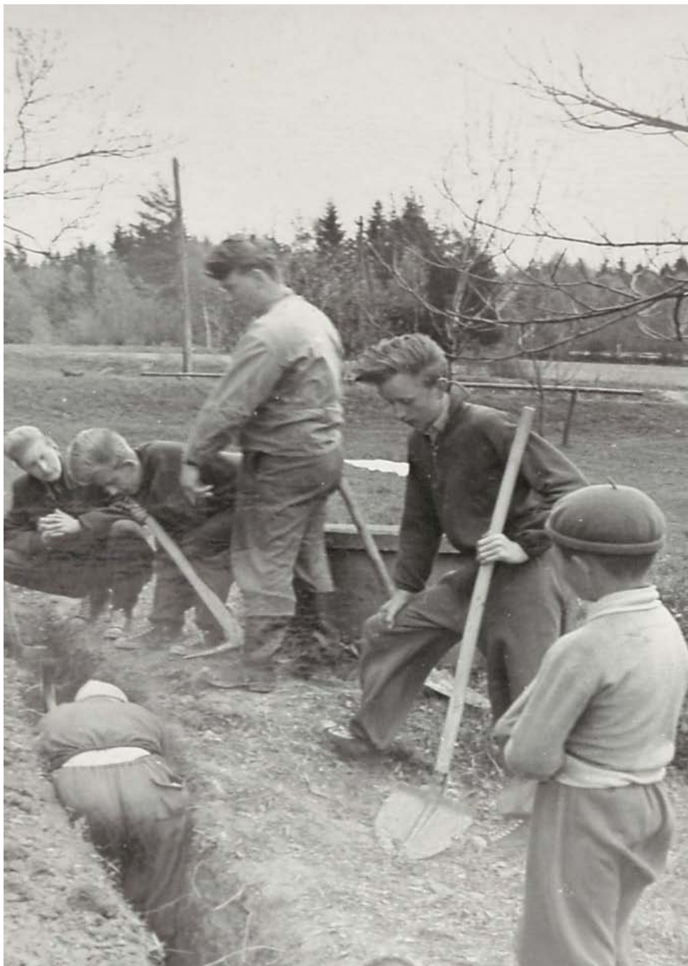
stavba sokolovny v akci "Z"