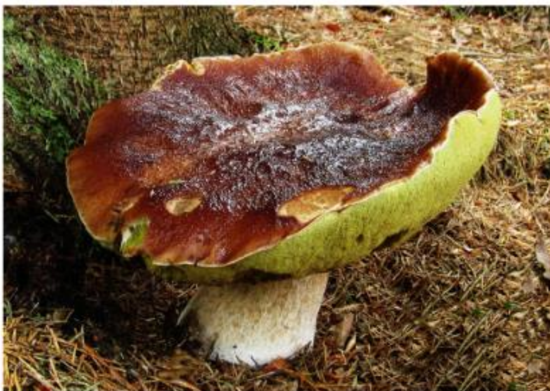
Hřib smrkový - v naší lokalitě od června do listopadu.