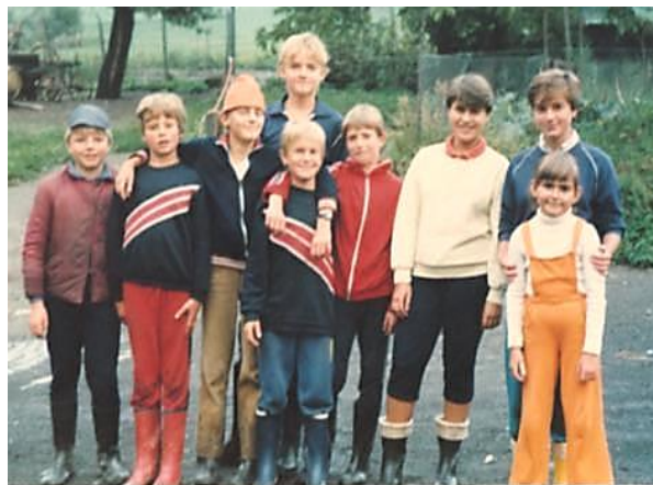
Foto: prázdniny v Loužnici rok cca 1985 (kola, na řídítkách zavěšené plavky a koupaliště, les a gumáky na nohou ☺ )