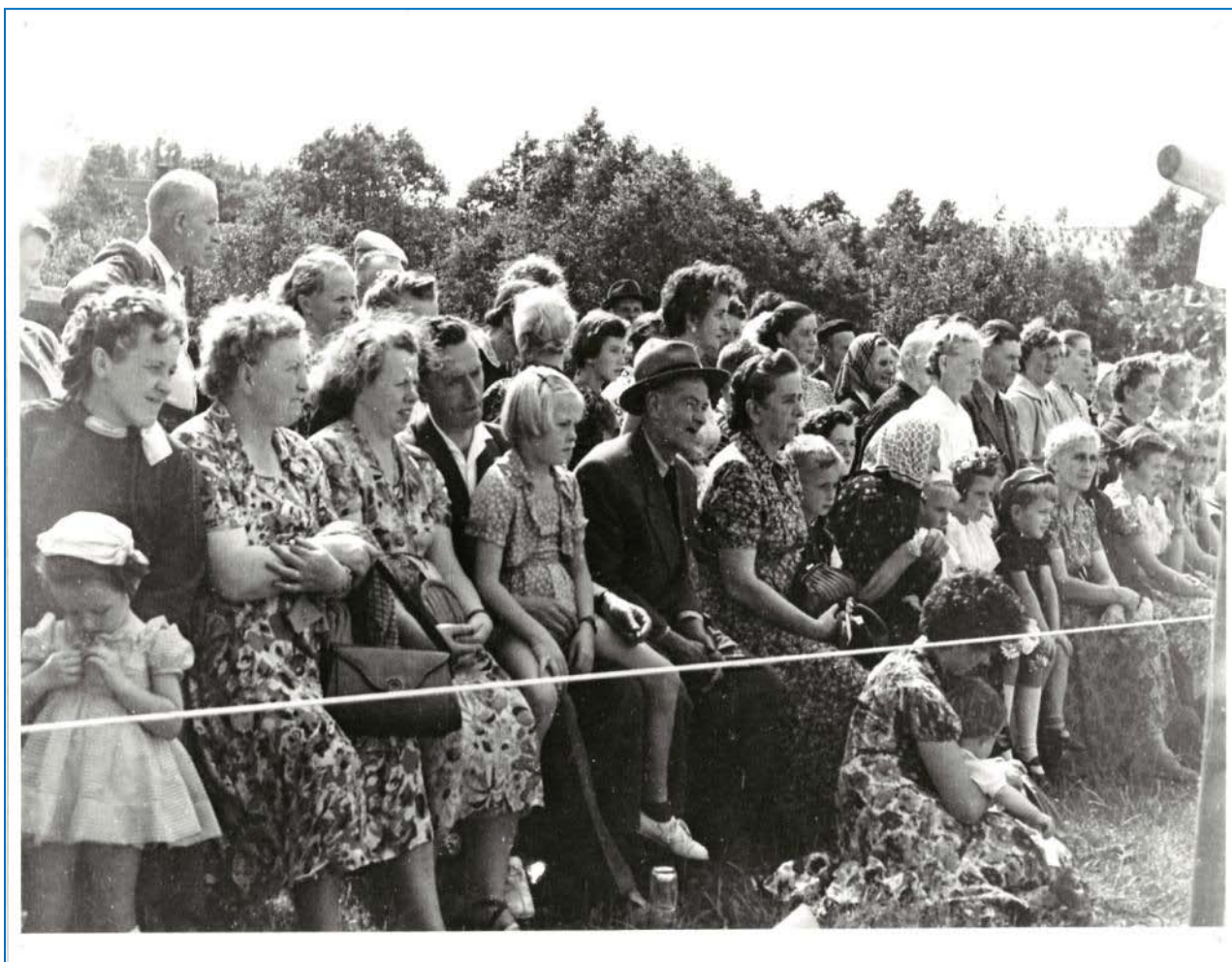
Na loužnickém koupališti – diváci Sokolského sletu....

Potí-li se Dominik, bude ještě Marek v kožiše.