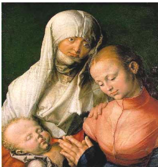
Svatá Anna je patronkou těhotenství a všech těhotných žen.

Jaroměř samozřejmě nebyla jediným místem, kde se lid tak krutě bavil. Shazování kozla prováděli naši předci i na Boleslavsku, v okolí Kolína, na Hlinecku, Chrudimsku, v okolí Pelhřimova a na mnoha dalších místech. Pozadu nezůstala ani velká a „civilizovaná“ města, jako byla kupříkladu Praha, kde shazovaly kozla ze svatojakubské věže na Starém městě, ale i z věže kostela sv. Lazara u Novoměstské radnice. Někde maso zabitého kozla prodal řezník hned, stejně tak jeho krev, po které vzhledem k její údajné kouzelné moci, bývala velká „poptávka“. Jinde se odpoledne na sv. Jakuba sešla celá ves v hospodě a kolem ní, kde se pořádalo veselí na počest kozla a kde byl také pořádán. Celá slavnost byla postupně zrušena povětšinou v polovině 19. století.