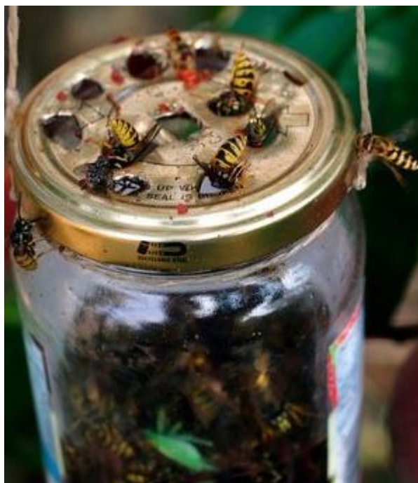
Lapač z PET lahve, nebo zavařovací lahve s dírkami jen pro vosy, vosy vletí dovnitř a už ne ven. Nalákejte je na pivo, či sladkou šťávu a lapač dejte dál od místa, kde se pohybujete