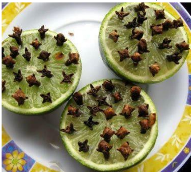
Hřebíčky v citronu, odeženu veškerý hmyz

Vosy patří k létu, ale když si chcete v klidu něco dobrého sníst na zahradě, jsou nebezpečím. Zde je několik tipů, jak je odlákat.