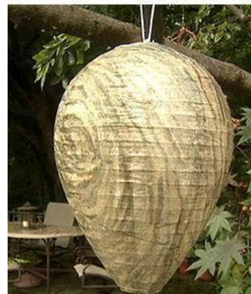
papírové pytle, naplněné igelitovými pytlíky zavěste na místech, kde nechcete vosy. Myslí si, že je to hnízdo sršní.