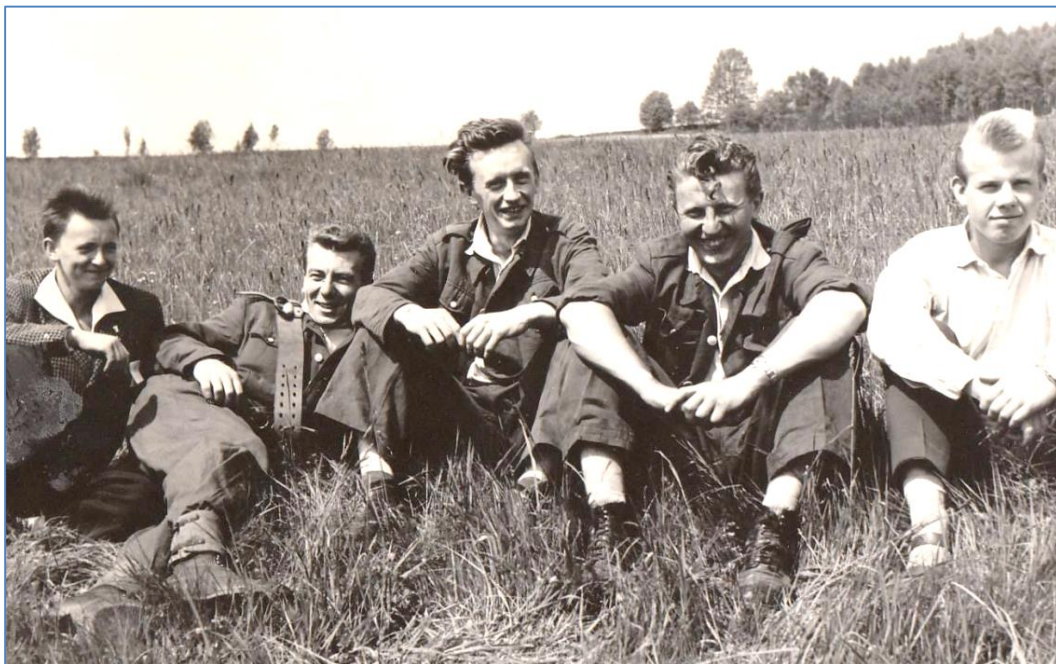
Foto: Požárníci Loužnice rok cca 1964.

Během roku bylo organizováno 9 výborových schůzí a 4 schůze členské.