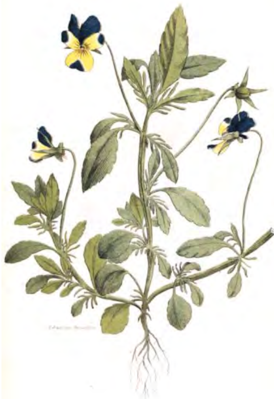
VIOLA TRICOLOR. (Orvokki, Styfnorsblomma).

Kopřiva dvoudomá Pampeliška - Smetanka Lékařská Sedmikráska chudobka Šťovík kyselý Petřel zahradní Červená řepa čekanka nať vřes nať šípek violka trojbarevná nať fazole plod pýr kořen