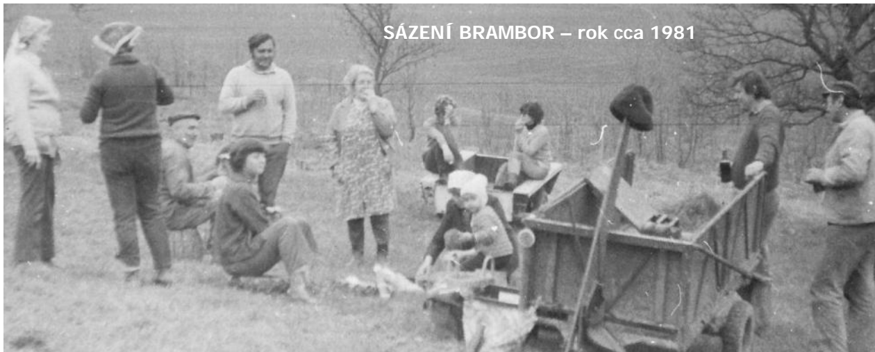
SÁZENÍ BRAMBOR – rok cca 1981

28.4. Mrzne-li na svatého Vitala, mrzne ještě 40 dní.