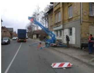
Jablonec n.N. s nákladní soupravou Mercedes Benz

SEMILY - V pondělí 26. dubna ráno krátce po sedmé hodině bylo zjištěno, že neznámý pachatel vnikl po rozbití okna do objektu firmy v Krkonošské ulici v Tanvaldě, ze kterého následně odcizil dvě počítačové sestavy v celkové hodnotě čtyřicet tisíc korun. V tomto objektu pachatel ještě páčením poškodil tři dveře a škoda na poškození věcí se tak vyšplhala na částku 15.000,- Kč. Pachatel se tímto skutkem dopustil trestných činů krádeže a poškození cizí věci, za které mu hrozí trest odnětí svobody až na dva roky.