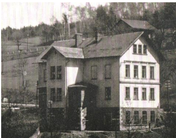
Foto: pohled na školu Loužnici.

Žádost jeho o stejnou odměnu jako byla v Bratříkově, byla pány členy obecního výboru (hlavně členy z Bratříkova) zamítnuta.