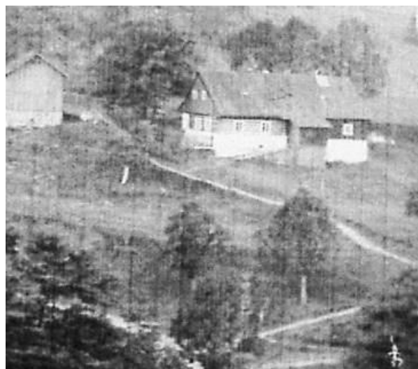
Foto: čp. 85 (Tilerovi), čp. 86 (Smetanovi – nestoji), čp. 87 (Sochorovi), čp. 8 (Čajkovi)