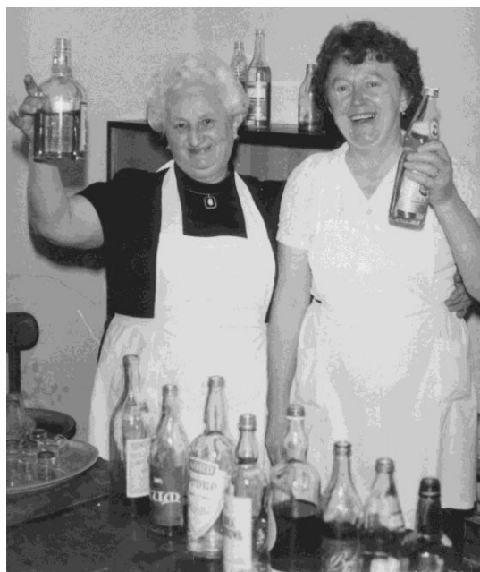
Foto: Výbor Žen při práci (obsluha stánku, úklid Kulturního Domu, obsluha na Haluškovém plese)