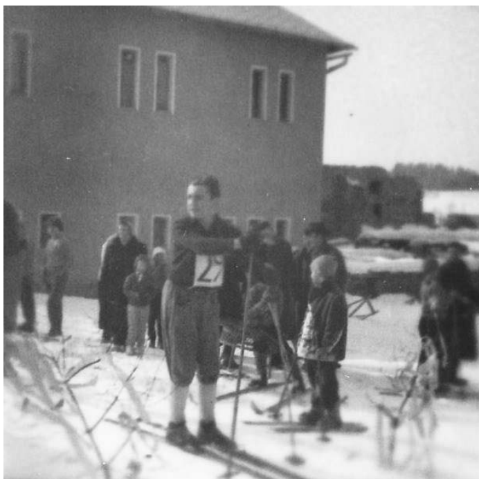
závody na běžkách u sokolovny – rok cca 1963