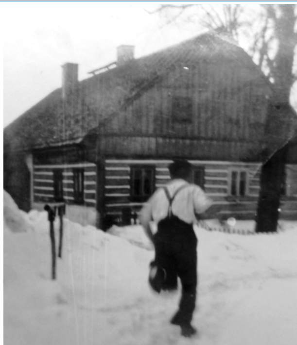
Zima U „Pazderny“ – rok ?

Je zde pravidelně vyfocen „měřák sněhu“ na naší zahradě, jedná se o tyč, 190 cm vysokou a jsou na ní vyznačeny rysky po 10 cm. Červená ryska ukazuje 1 metr.