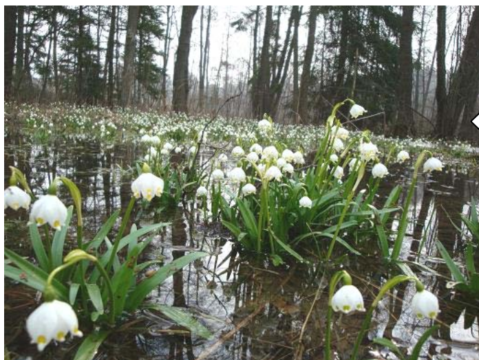
jaro v Loužnici u Kopaňského potoka 2009