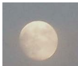
Úplněk – v noci z 28.2 na 1.3.2010 Loužnice