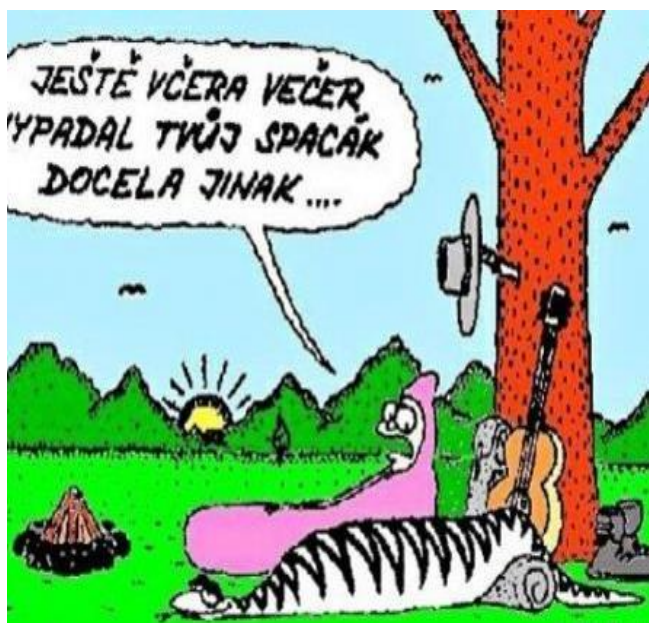
JESTĚ VČERA VEČER VYPADAL TVŮJ SPACÁK DOCELA JINAK ....